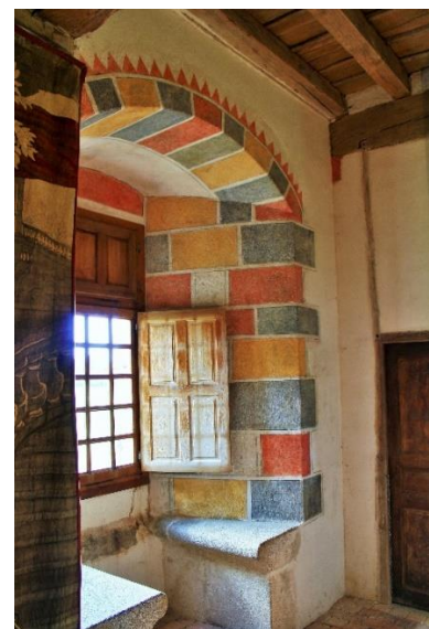
Restauration de peintures d'époque