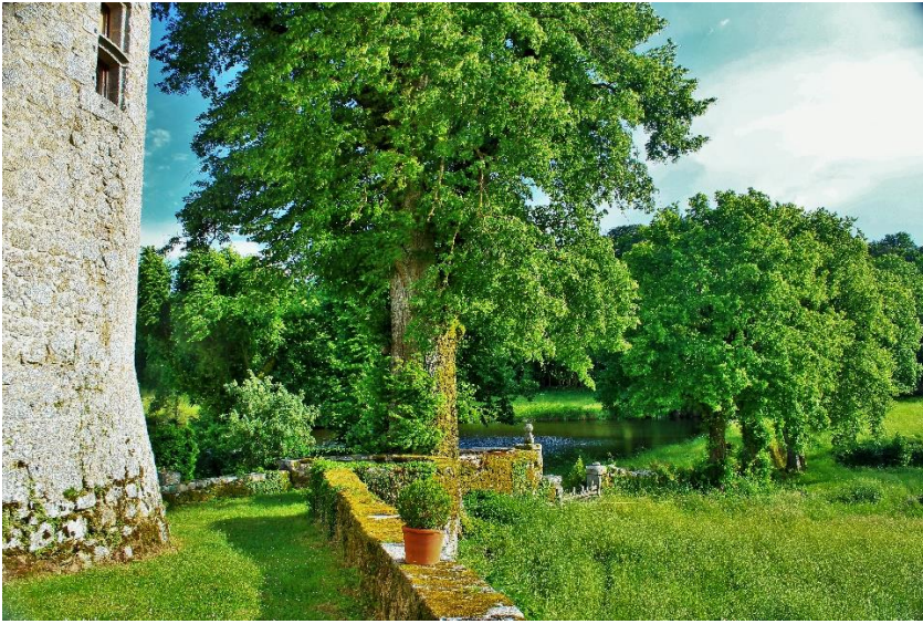
Le château était entouré d'étangs qui remplaçaient les douves