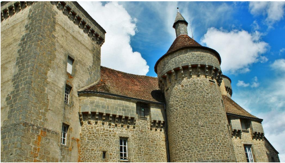
Ci-dessus : Machicoulis / Ci-dessous : Plafonds peints 16 ème siècle