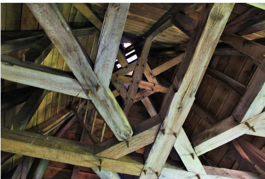
Détail de la charpente dans une tour