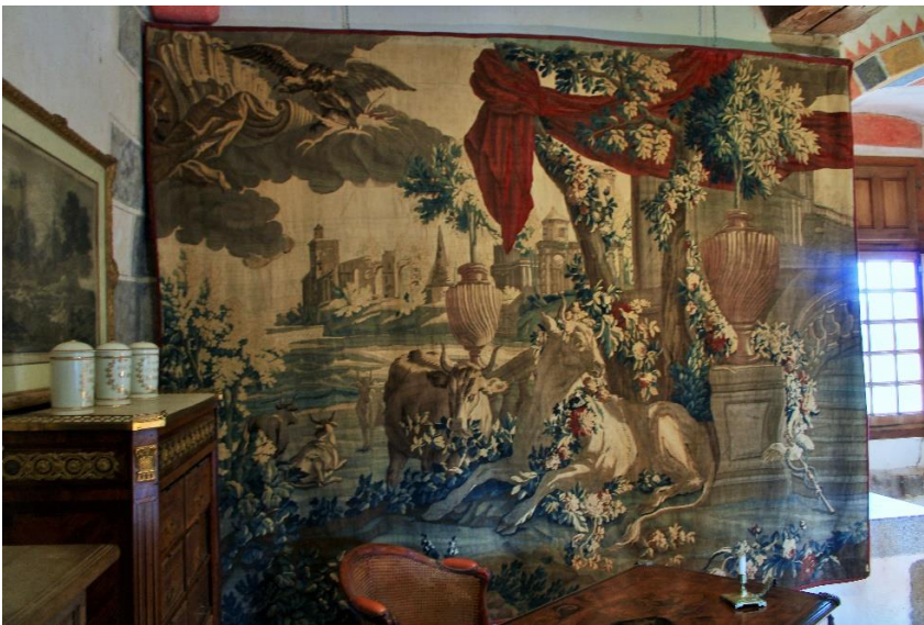
Tapiserie représentant Zeus et Io