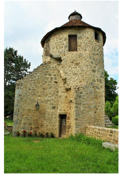
Tour d'angle du rempart