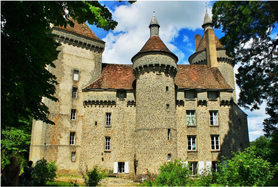
Tour carrée du 13 e . Tours rondes et corps de logis du 15 e siècle