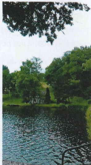
(4) Etang Creux : sauvage— creux de verdure