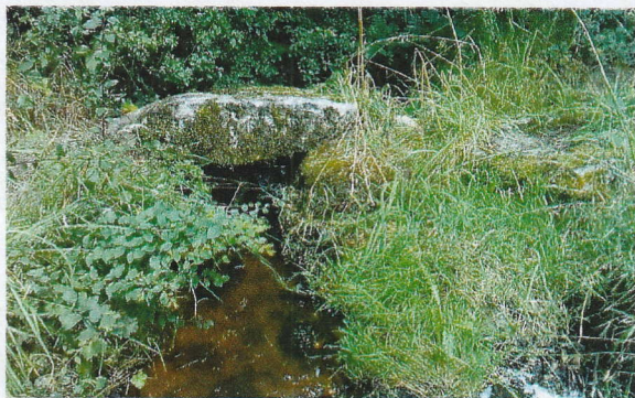
(3) Pont-planche sur le Chat cros à Péret