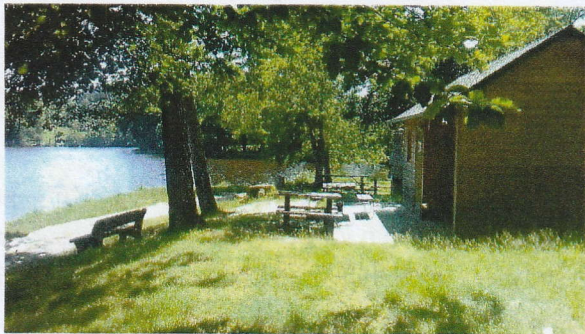
(2) Étang municipal : cabane des pêcheurs (Association de pêche) aire de repos et table de pique-nique