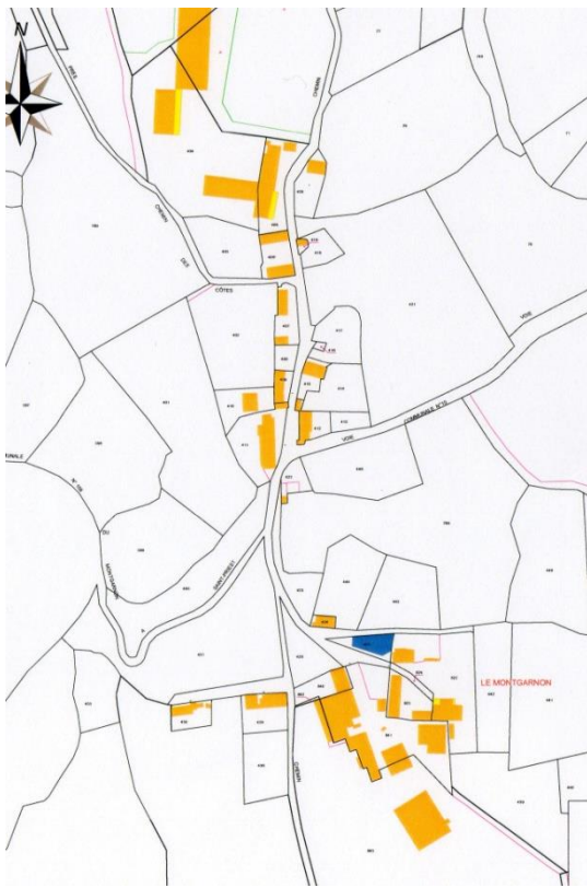
Plan cadastral actuel