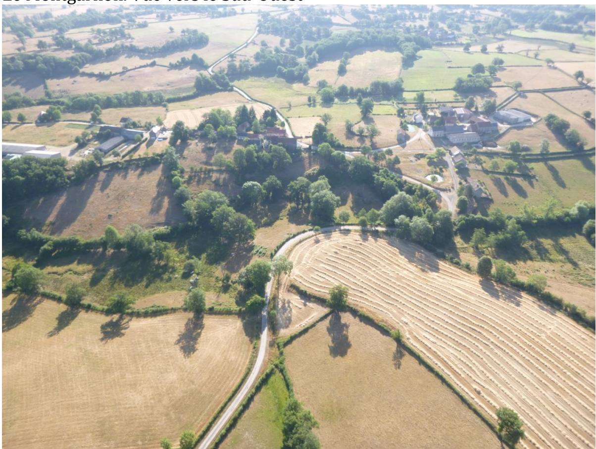
Le Montgarnon. Vue vers l'Est.