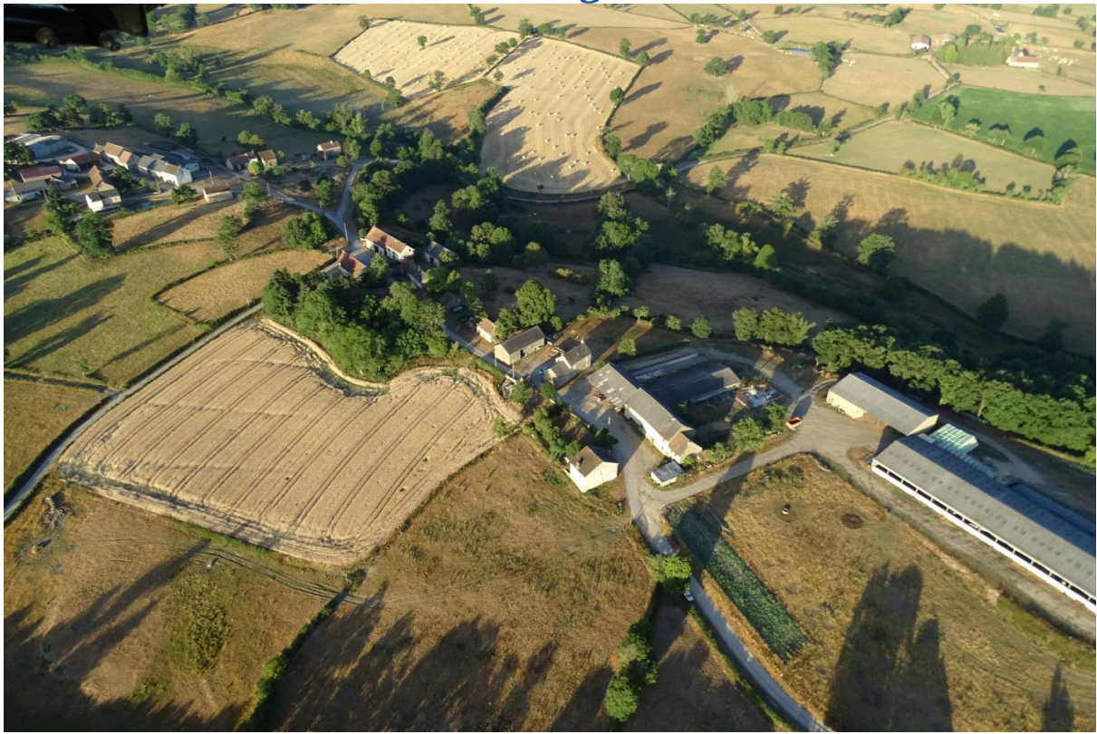
Le Montgarnon. Vue vers le Sud-Ouest